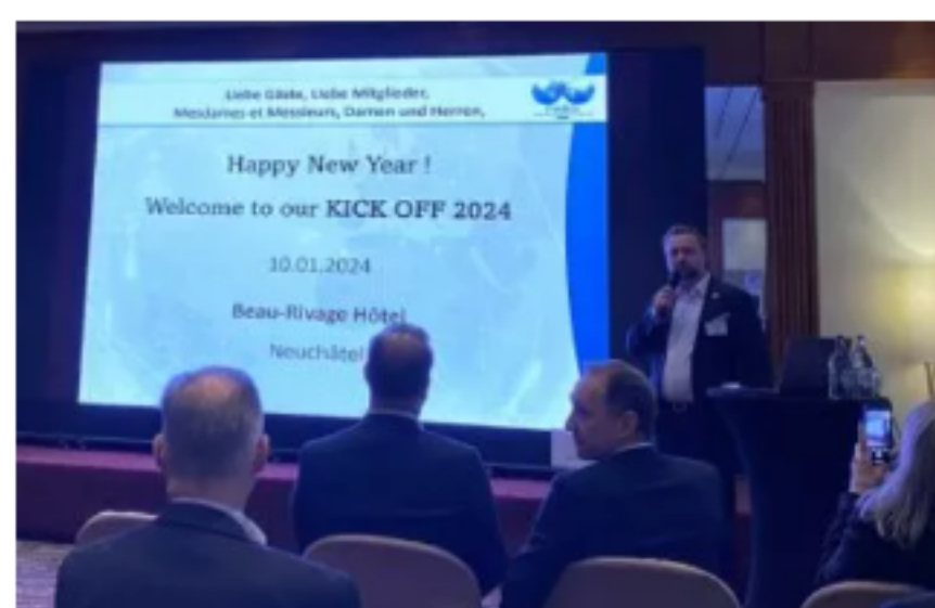
FIABCI-SUISSE: Kick-off ins neue Jahr 2024